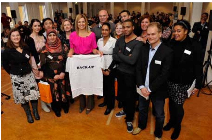
Prinses Máxima met het Back-up team – met rechts van Máxima 'kopsterke spits' Willem

Het Oranje Fonds – een van de subsidiënten van School's cool Delft – organiseerde op 2 december jl. de werkconferentie "Back-up" in het Museum voor Communicatie in Den Haag. De conferentie stond in het teken van de diverse maatschappelijke initiatieven die momenteel bestaan en die gebruik maken van de inzet van vrijwilligers om de schoolkansen van jongeren te vergroten. Namens School's cool Delft waren Joan Koene, Mirjam Biegstraaten en Willem van Haasteren, een van de mentoren, aanwezig.